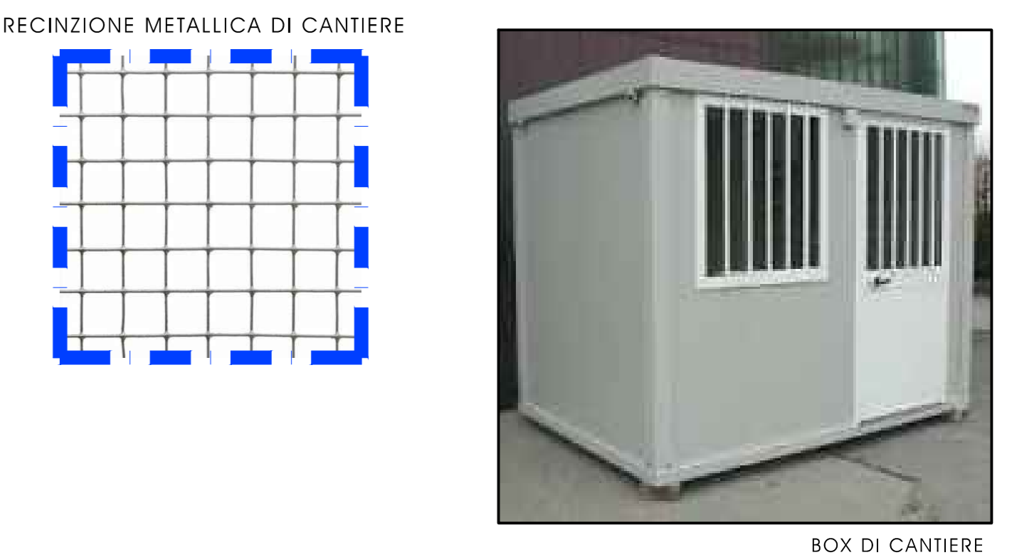
BOX DI CANTIERE