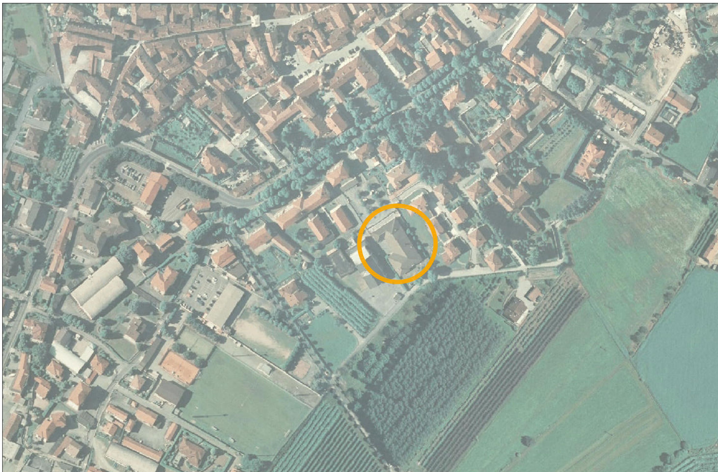
ESTRATTO ORTOFOTO REGIONALE