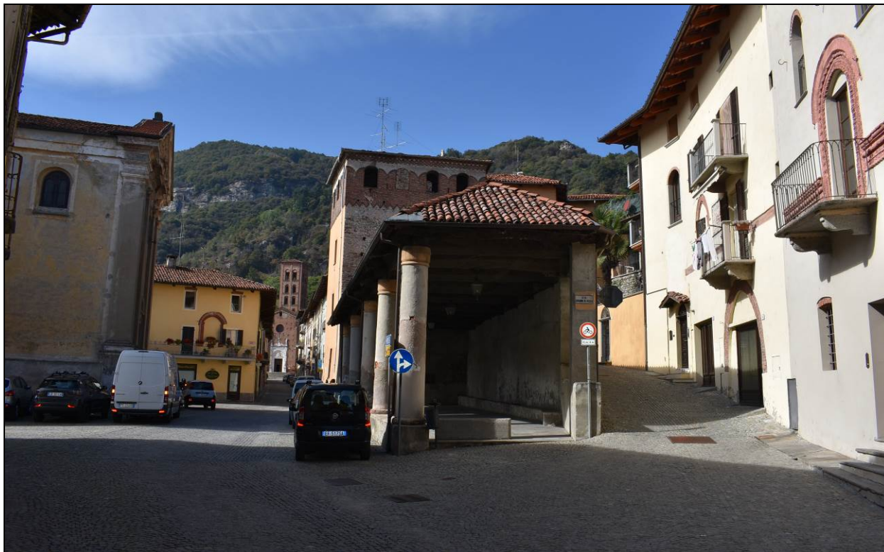
Figura 1 – Vista sull'incrocio tra Piazza Denina e Via Salita alla Maddalena