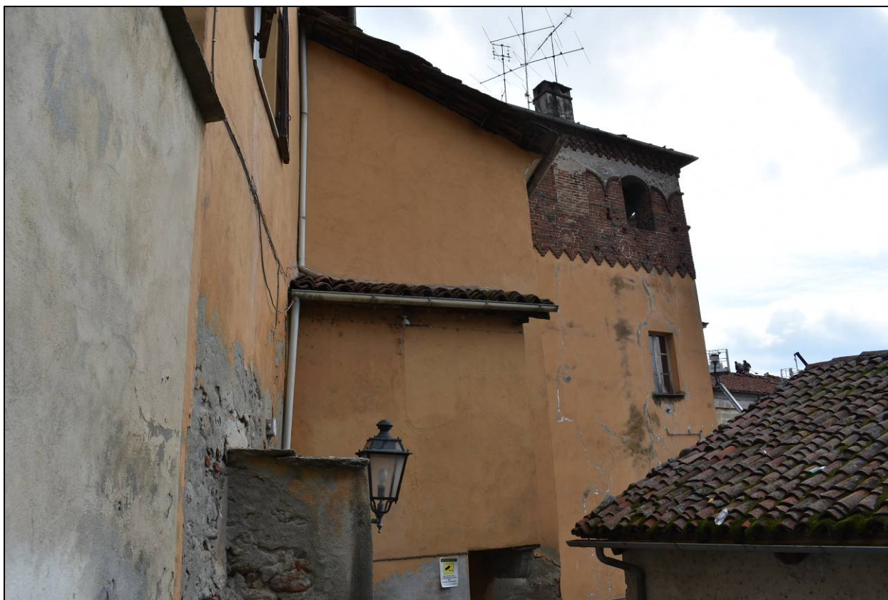
Figura 9 - Vista Prospetto Ovest