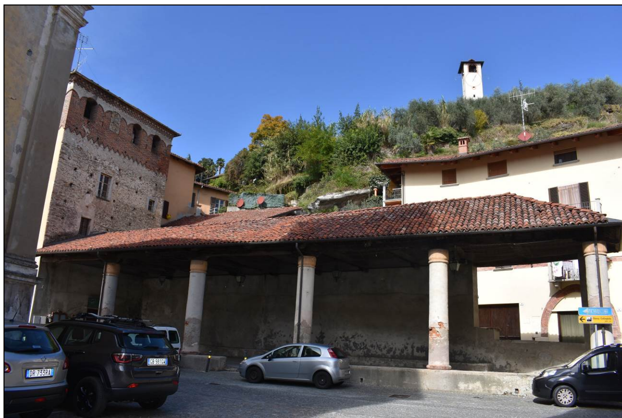
Figura 4 – Vista del mercato coperto situato a fianco dell'immobile oggetto di intervento