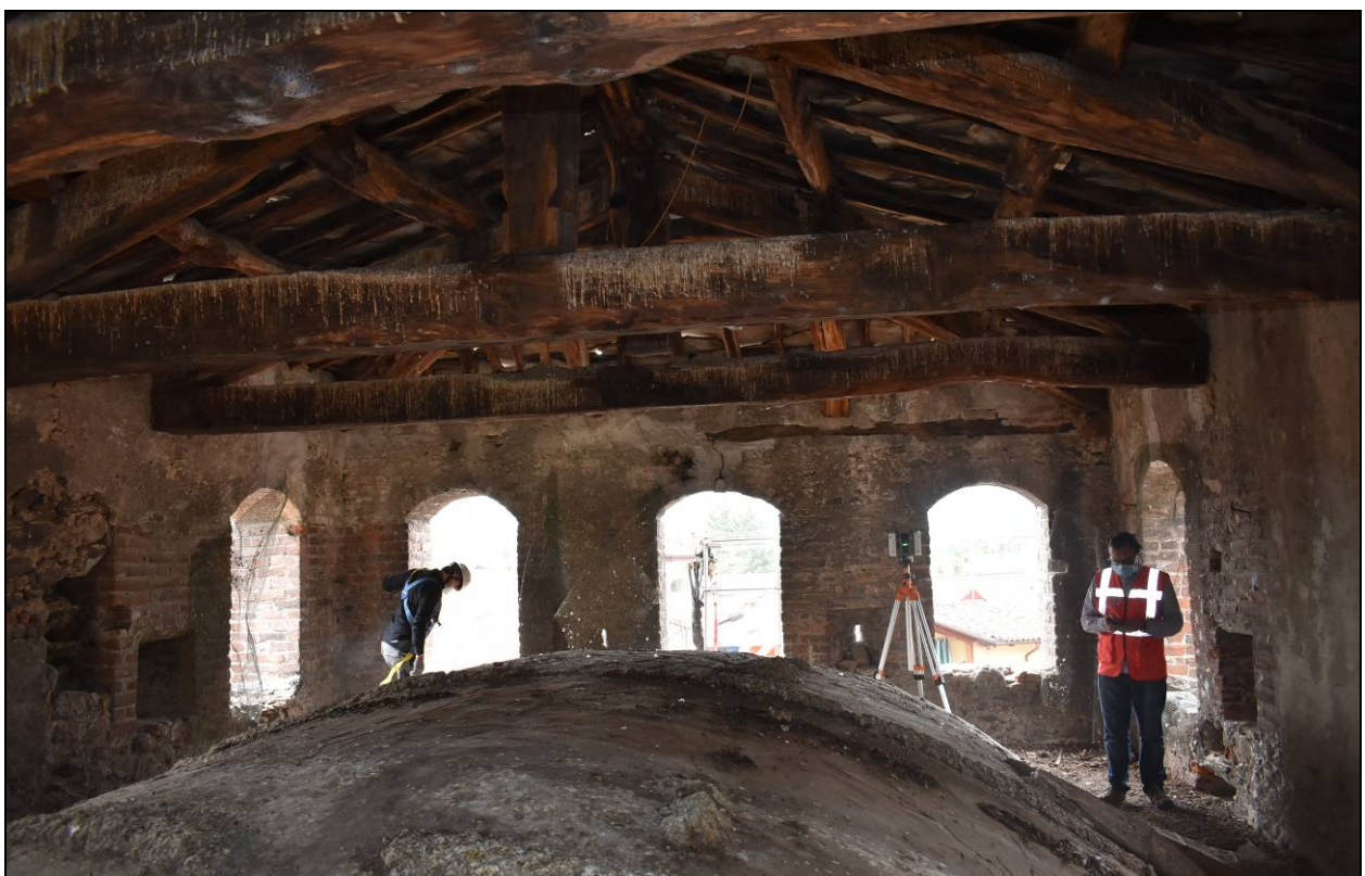
Figura 12 – Vista piano Terzo - Sottotetto