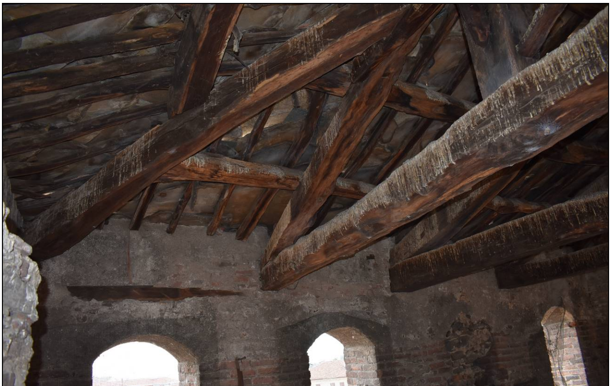
Figura 20 - Vista particolare dell'orditura della copertura