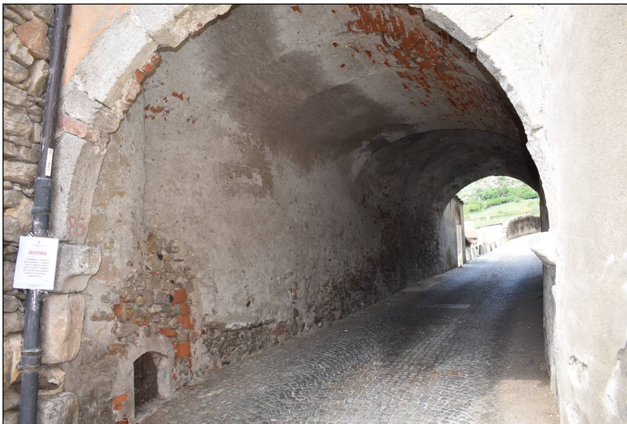
Figura 10 - Vista Tunnel lato Nord