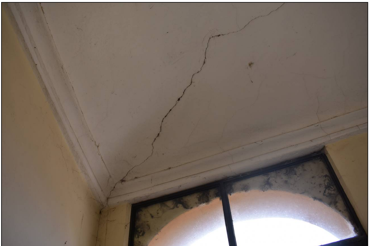
Figura 24 – Vista Lesioni Volta Vano Scale