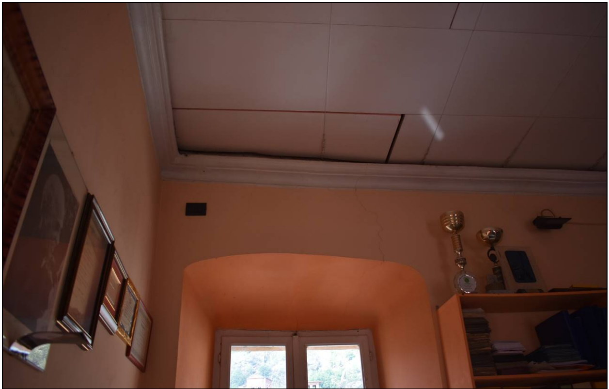
Figura 23 – Vista lesione apertura piano secondo