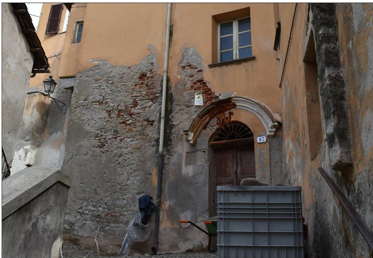
Figura 15 - Vista lesioni su intonaco- prospetto sud – vano scale