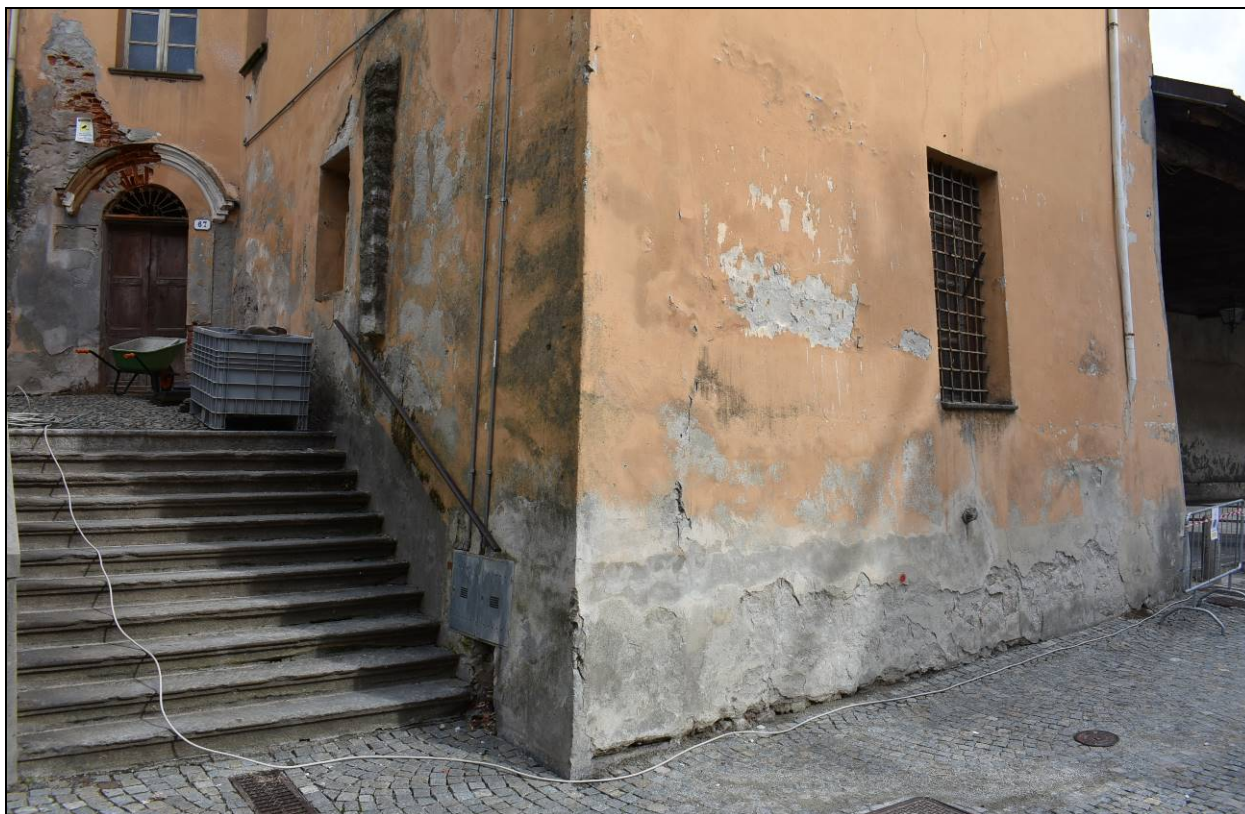
Figura 13 - Vista lesioni parte bassa prospetto sud