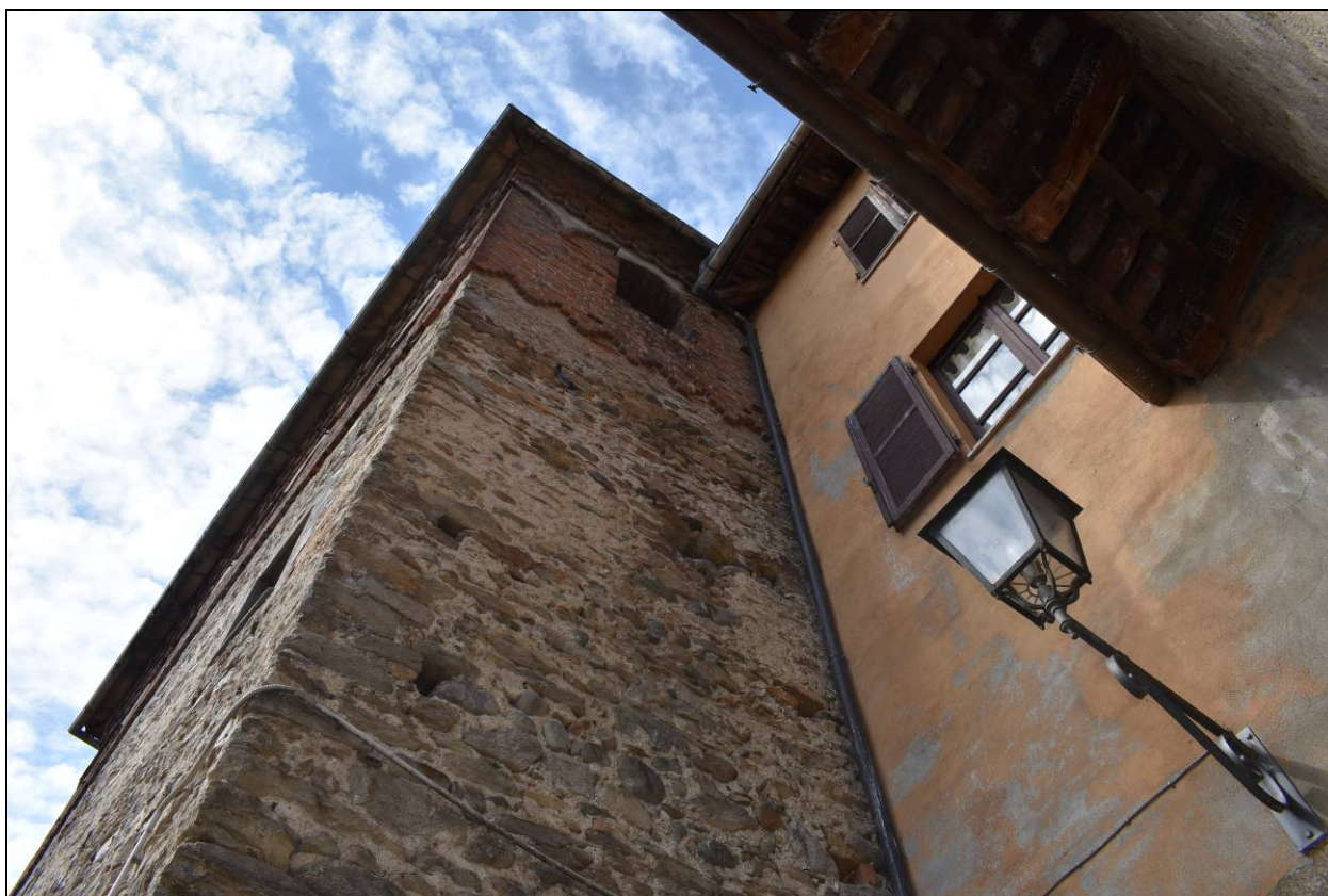
Figura 7 - Vista Prospetto Nord