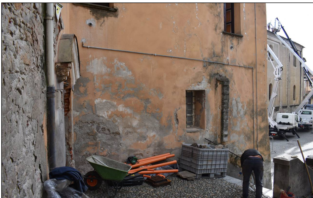
Figura 16 - Lesione prospetto ovest - parte bassa