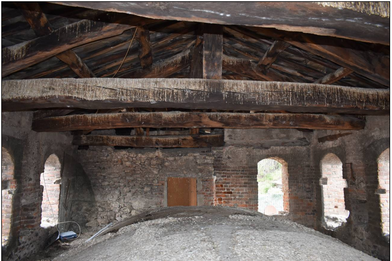
Figura 21 - Vista particolare dell'orditura della copertura