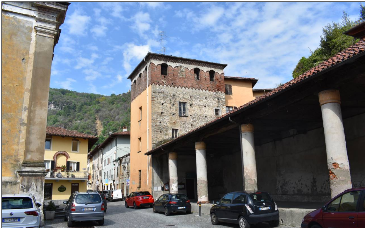
Figura 5 – Vista Prospetti Sud ed Est