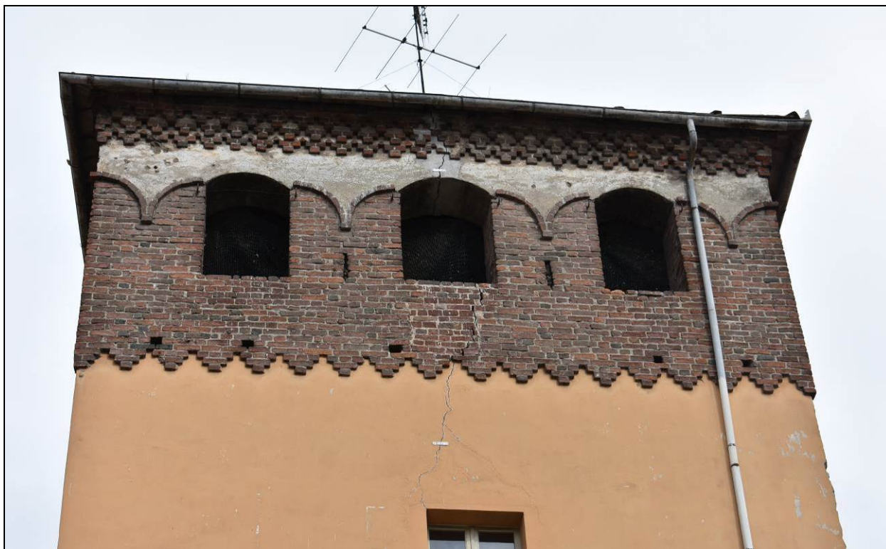
Figura 18 – Lesione strutturale prospetto sud - parte alta