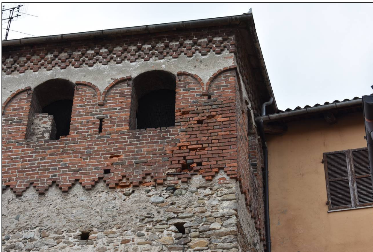
Figura 17 - Particolare lesione prospetto est - muratura in mattoni faccia a vista