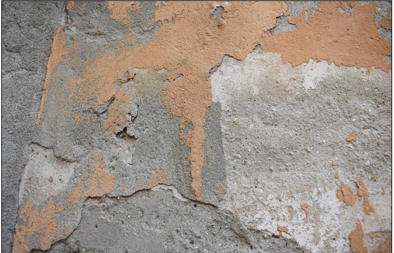
Figura 19 - Particolare strati intonaco e coloratura di facciata