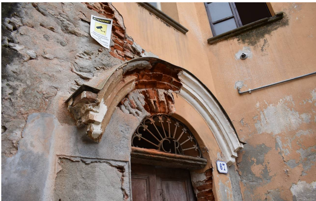
Figura 14 - Vista lesioni porta di accesso vano scale