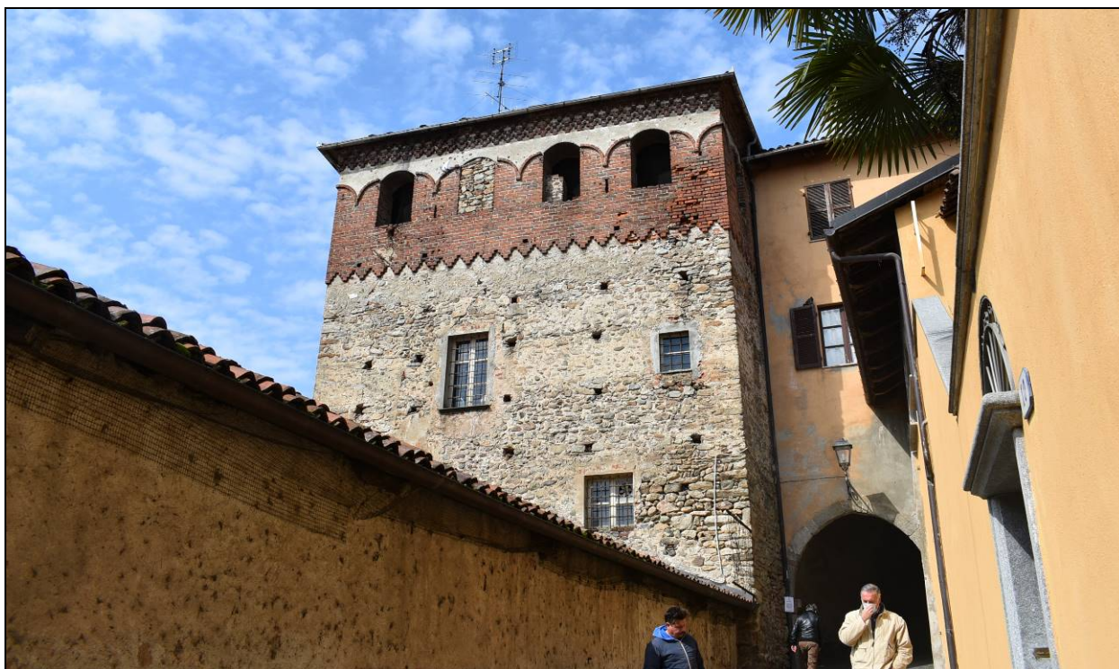
Figura 6 - Vista Prospetti Est e Nord