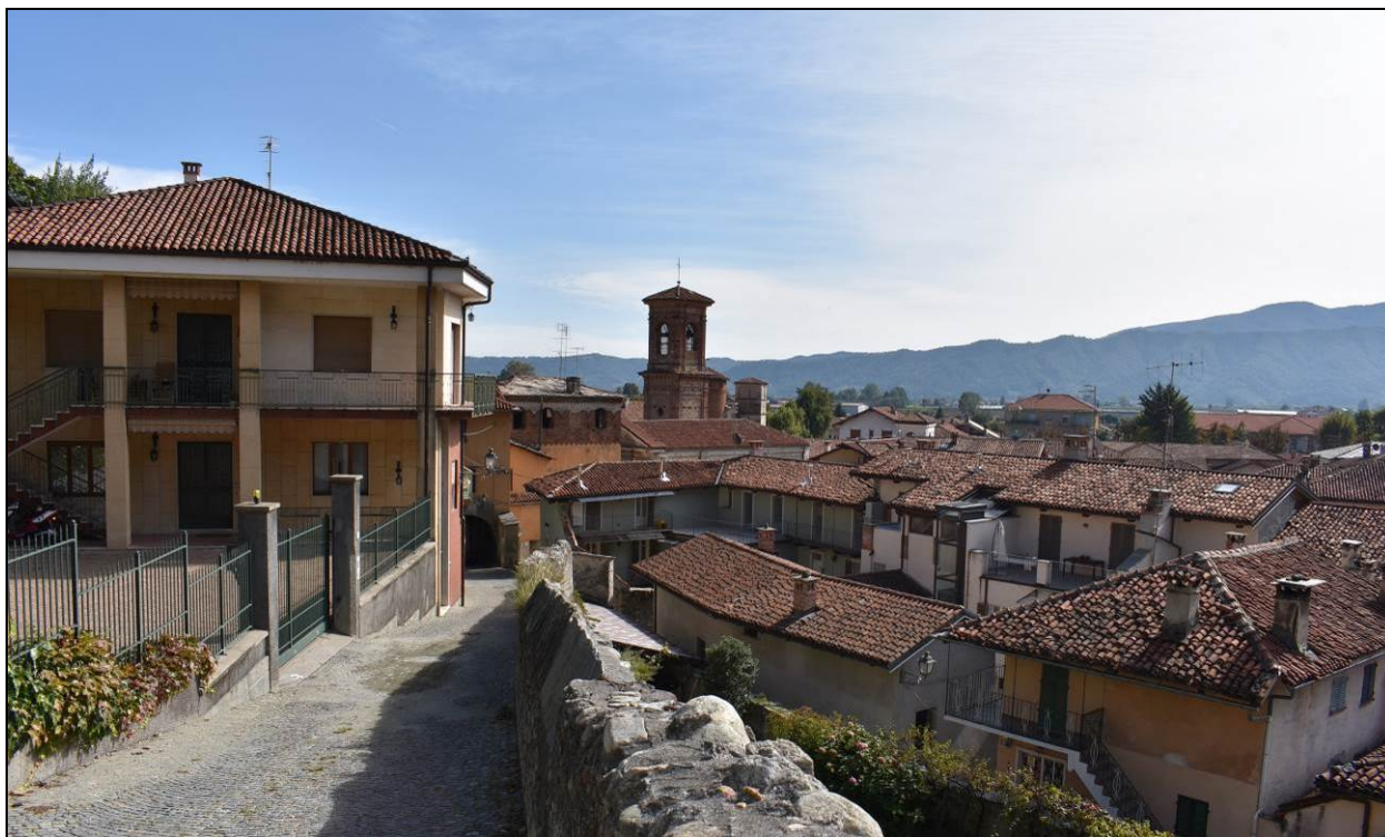
Figura 2 – Vista dell'immobile oggetto di intervento nel suo contesto, da Via Salita alla Maddalena