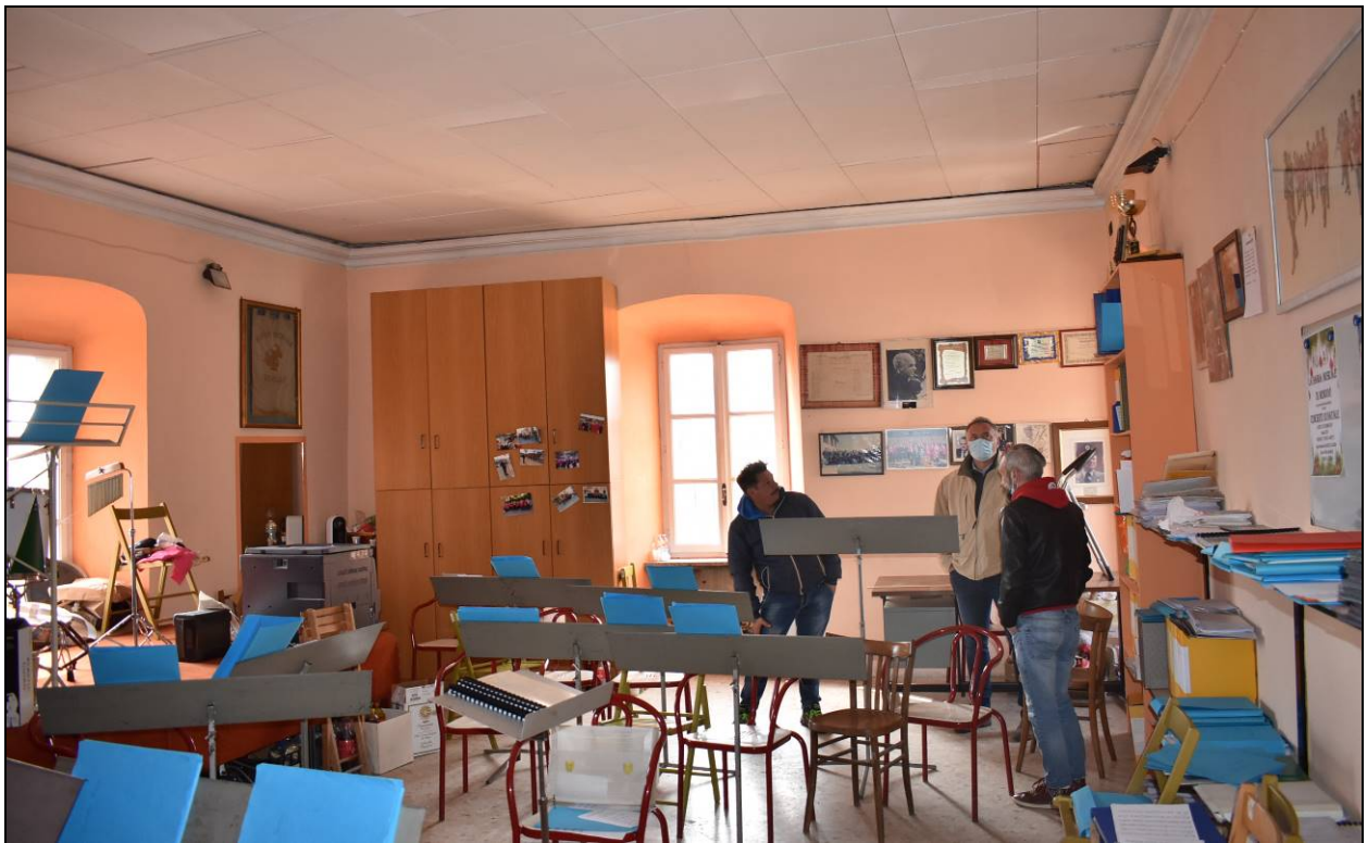
Figura 11 - Vista Piano Secondo