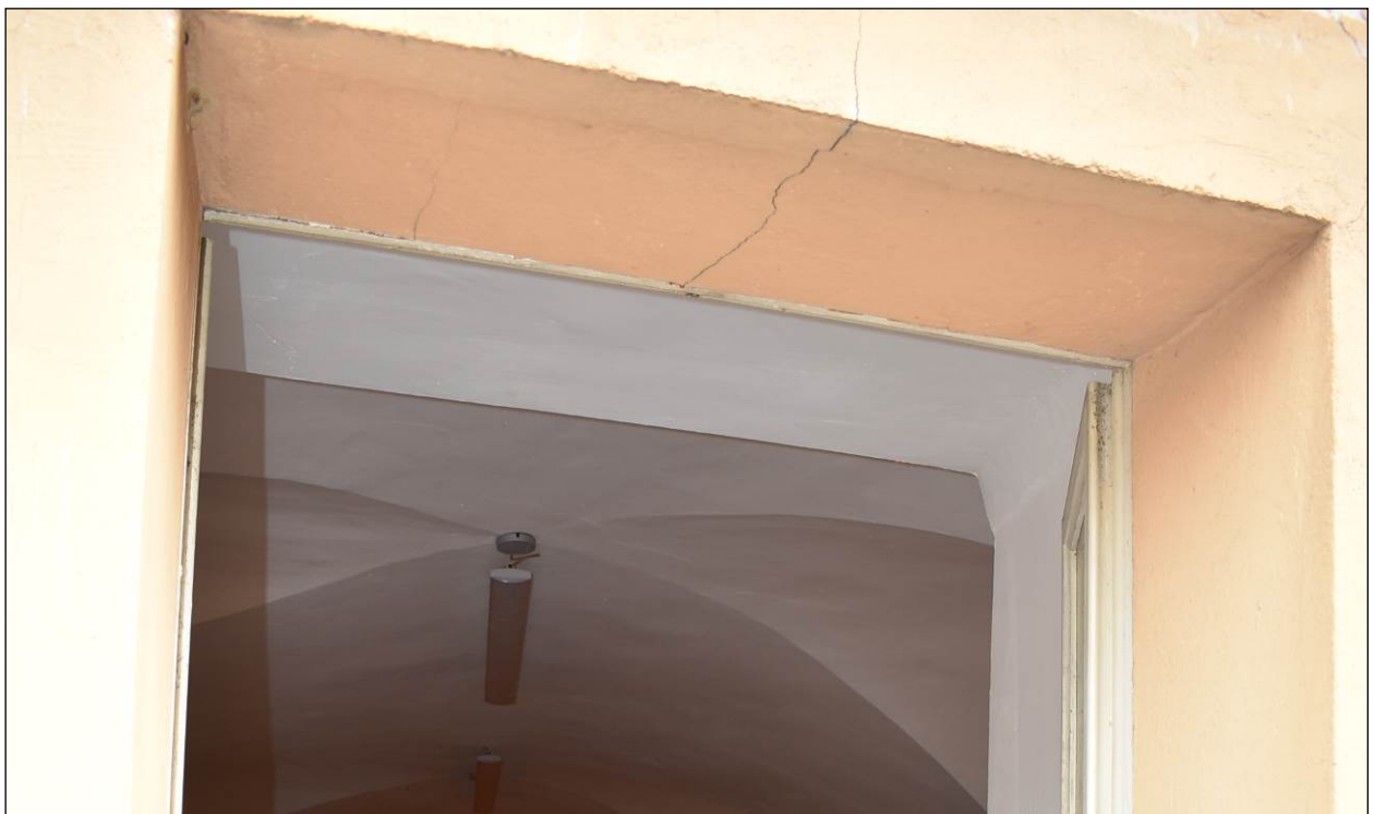
Figura 22 - Vista lesione su apertura prospetto sud piano primo