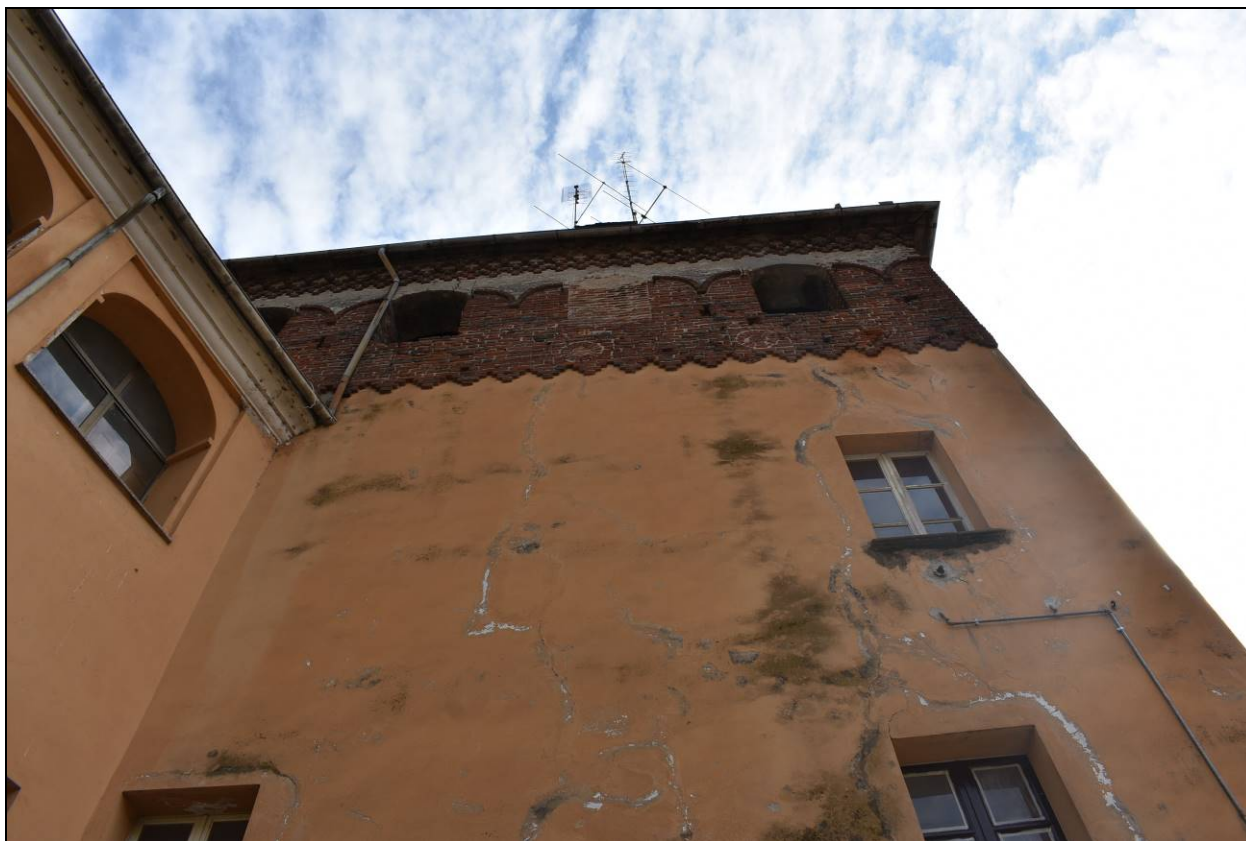
Figura 8 - Vista Prospetto Ovest