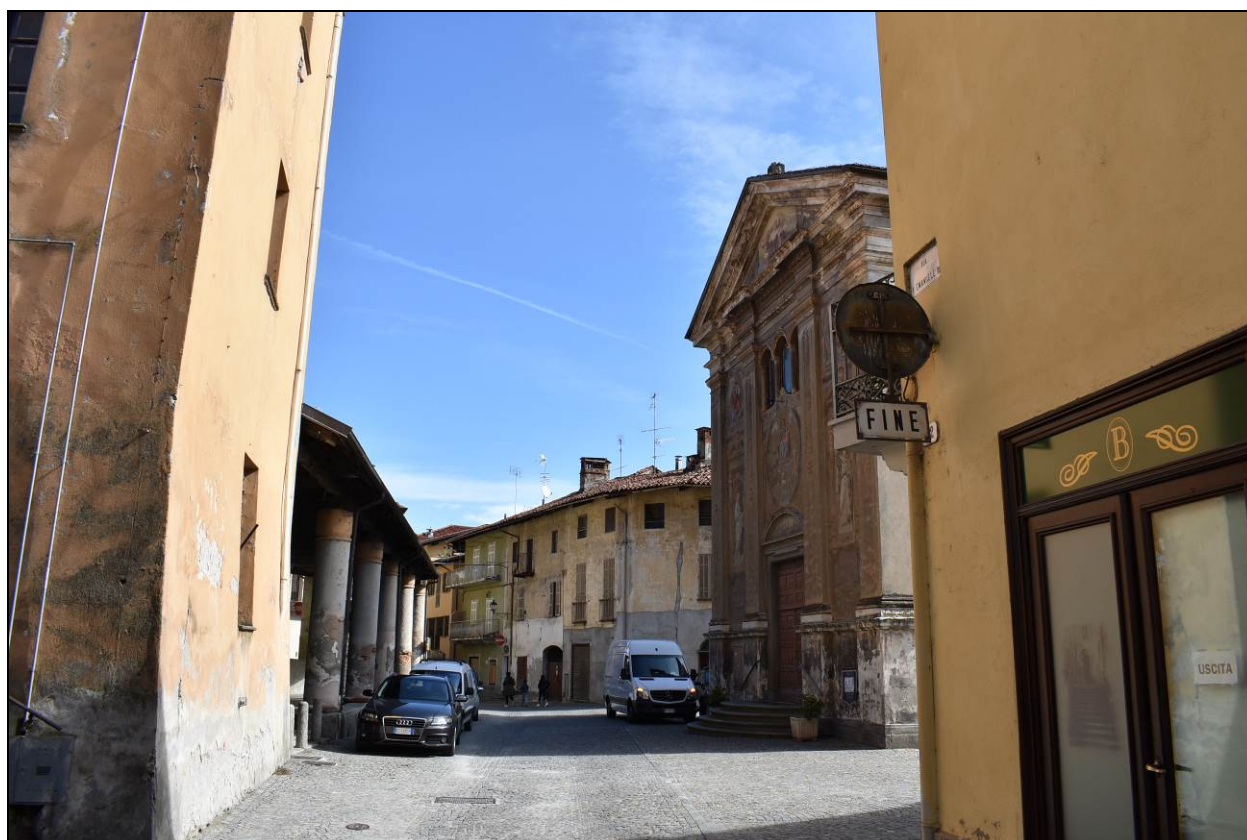
Figura 3 – Vista di Piazza Denina da Via Vittorio Emanuele III